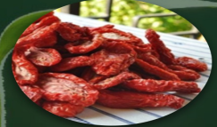
KURUTULMUŞ DOMATES ÜRETİMİ