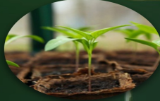
FİDE ÜRETİMİ TOHUM VE ZİRAAT