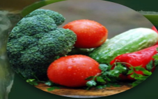
YAŞ SEBZE MEYVE PAZARLAMA İHRACAT